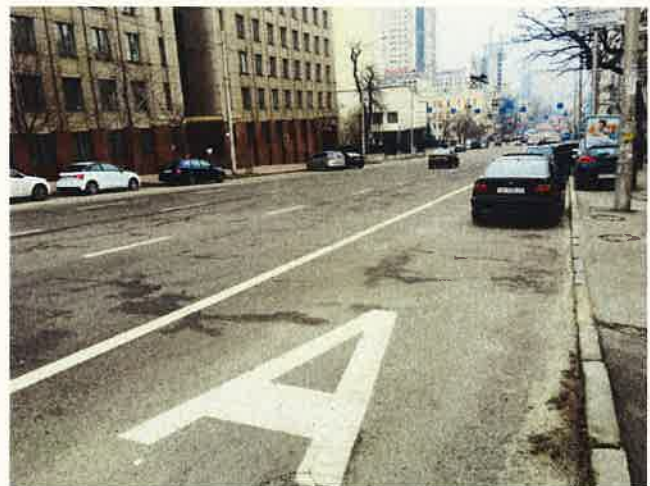
Фото: 24 січня та 3 лютого на Саксаганського (10:34) та на Антоновича (15:37)